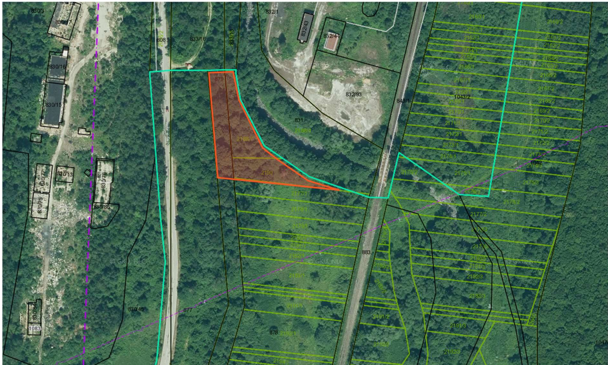
Obr. 2: Navrhované riešenie obce Nižná Slaná s vyznačením plochy, ktorú možno podľa potreby použiť na umiestnenie čističky banských vôd

Vyčlenené pozemky je možno použiť pre realizáciu zámeru a prispôbiť zabranú plochu rozsahu zámeru a projektovej dokumentácii.