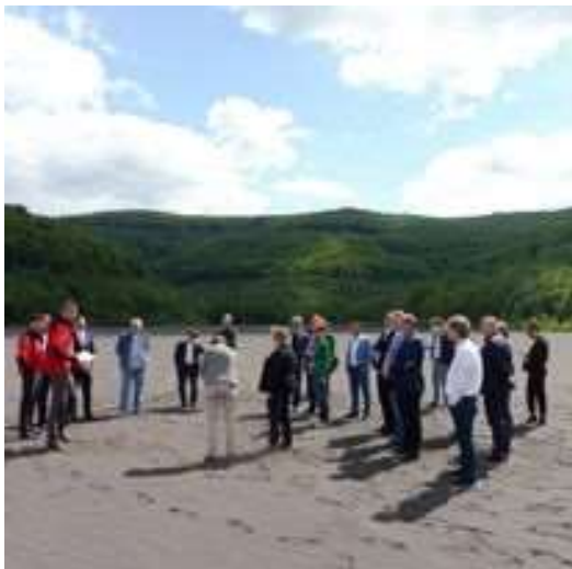
Obr. 14/VI/2021 - Poslanecký prieskum – Odkalisko