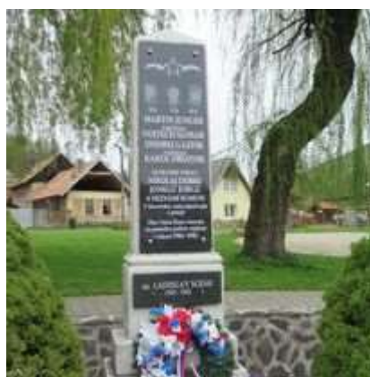
Obr. 10/V/2021 - Deň víťazstva na fašizmom - kladenie vencov