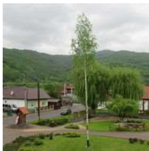
Obr. 12/V/2021 – Rusadlie