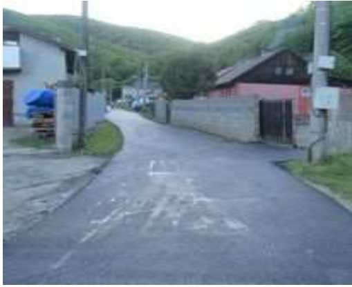
Obr. 13/V/2021 – Asfaltovanie povrchu cesty - ul. Rudná