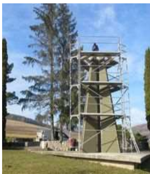
Obr. 20/XI/2021 - Rekonštrukcia pamätníka