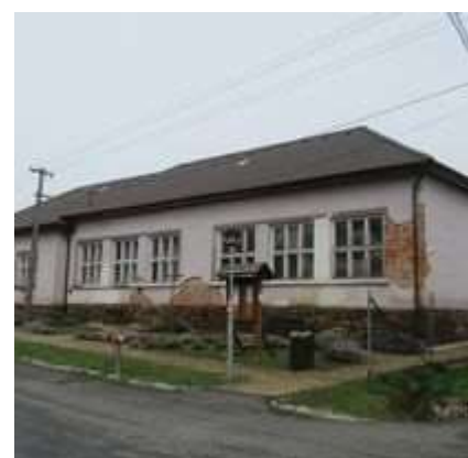
Obr. 3/IV/2021 Budova "Ľudovej školy"