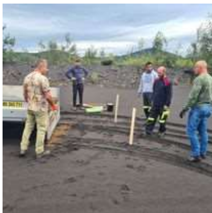
Obr. 2/IV/2021 - Pokus zatrávňovania odkaliska