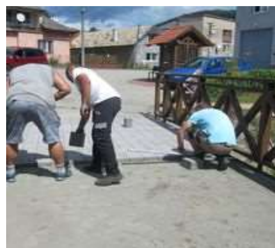
Obr. 17/VIII/2021 - Most pri pošte