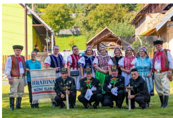
Obr. 19/IX/2021 - 13. stretnutie banských miest a obcí Slovenska