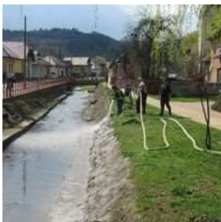
Obr. 7/IV/2021 - Čistenie Kobeliarovského potoka