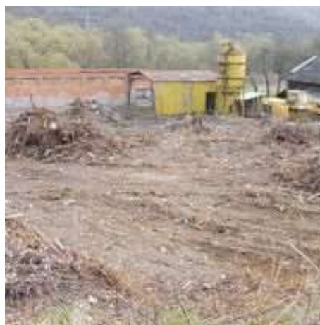
Obr. 6/IV/2021-Cesta k sociálnemu podniku