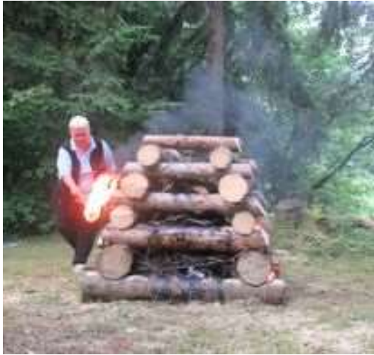
Obr. 15/VII/2021 - Vatra zvrchovanosti