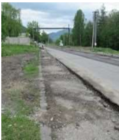
Obr. 11/V/2021 - Rekonštrukcia cesty 1. triedy