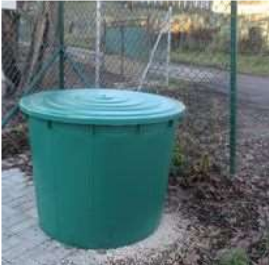
Obr. 22/XII/2021- zimná údržba