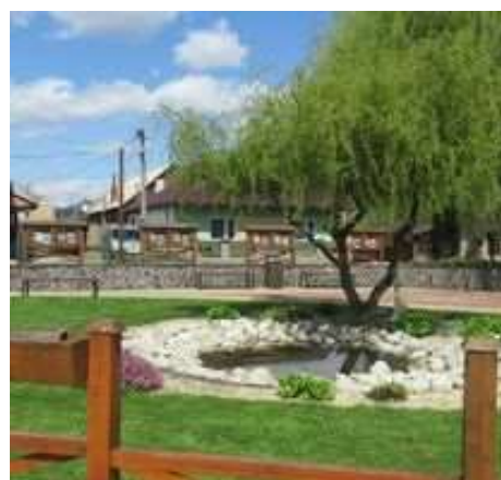
Obr. 8/IV/2021 - Verejná zeleň