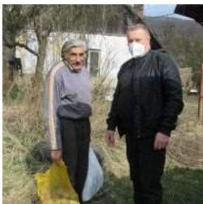
Obr. 1/I/2021 Potravínová pomoc