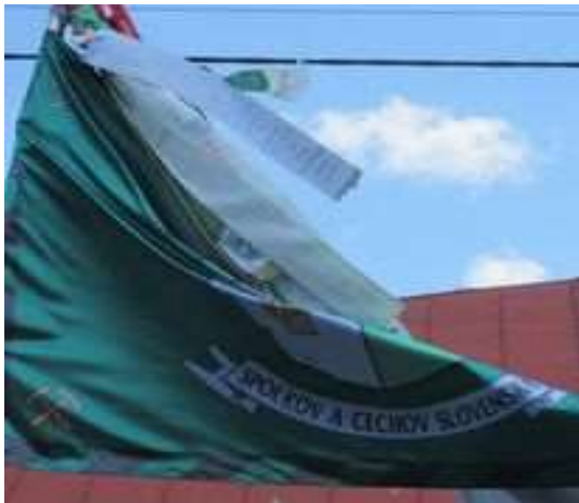
Obr. 16/VII/2021 - Putovná zástava do Nižnej Slanej