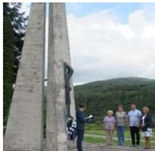
Obr. 18/VIII/2021 - Kladenie vencov na „Pališove“