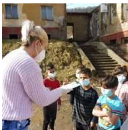
Obr. 4/IV/2021 - Projekt "Terénne pracovníčky COVID"