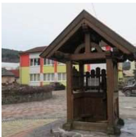
Obr. 5/IV/2021-Studňa na námestí SNP – opravy