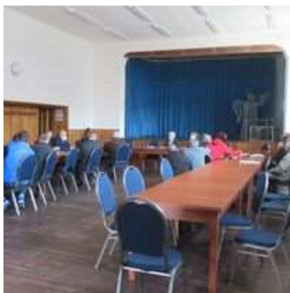
Obr. 9/V/2021 - Zasadnutie v Gočove - prašnosť odkaliska